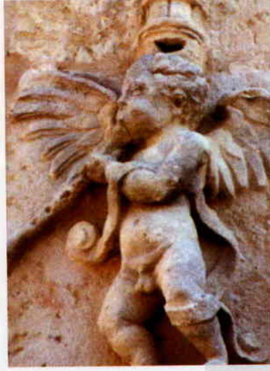
Àngels músics. Façana renaixentista de l'Església de Sant Vicent Màrtir. Guadassuar (València)